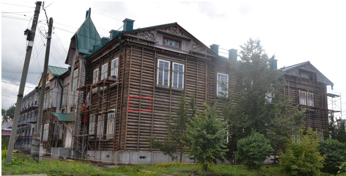
Фото фрагмента фасада с привязкой к месту установки информационной надписи.