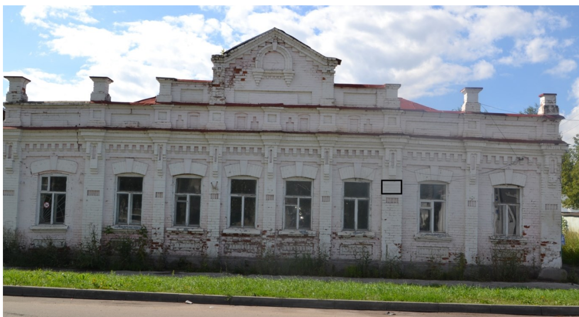
Фото фрагмента фасада с привязкой к месту установки информационной надписи.