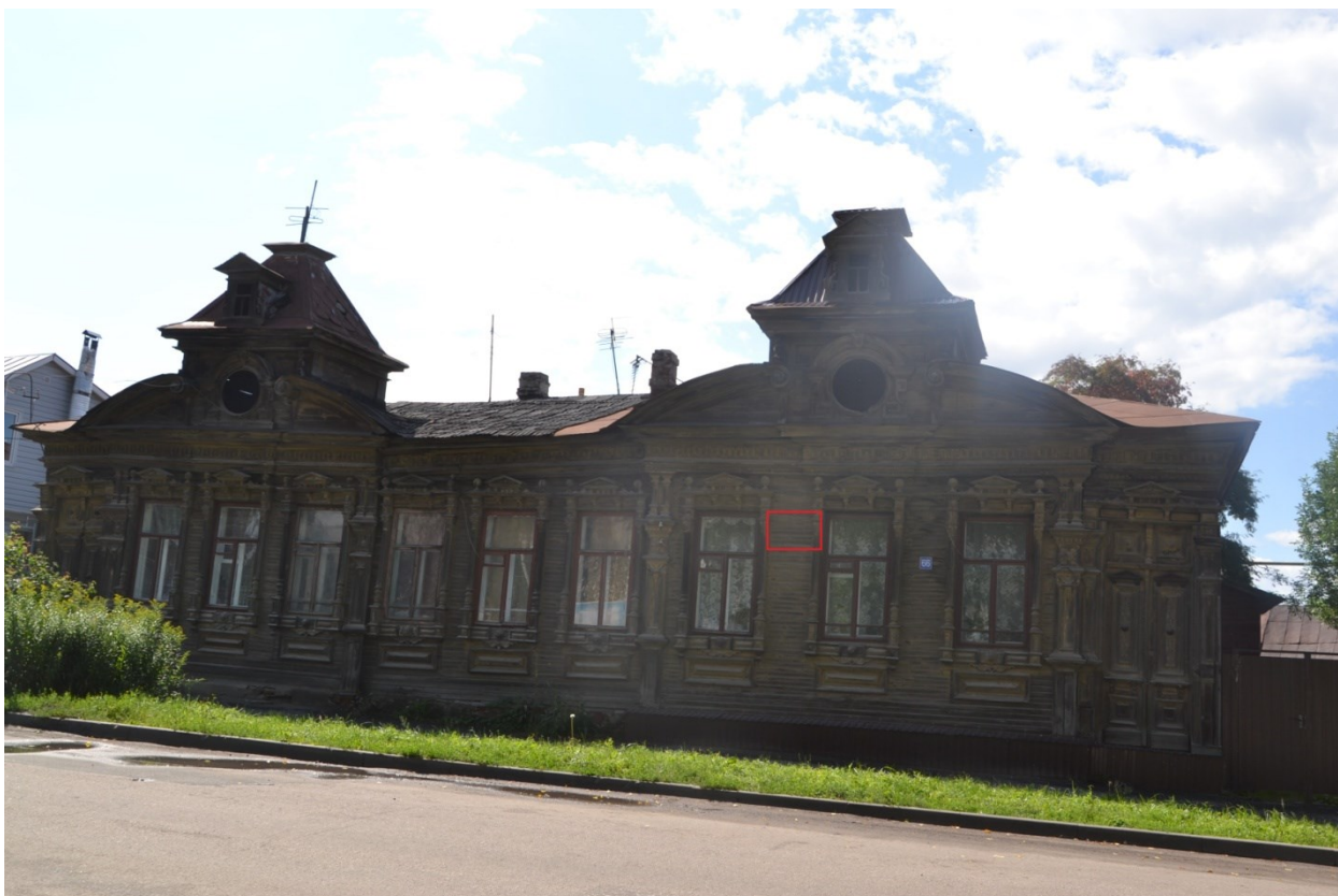
Фото фрагмента фасада с привязкой к месту установки информационной надписи.