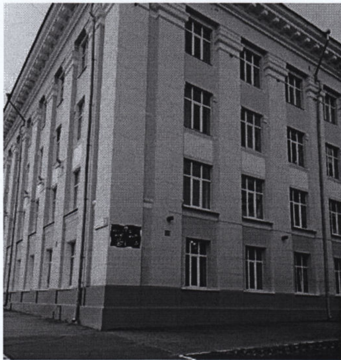
Фото фрагмента фасада с привязкой к месту установки информационной надписи.