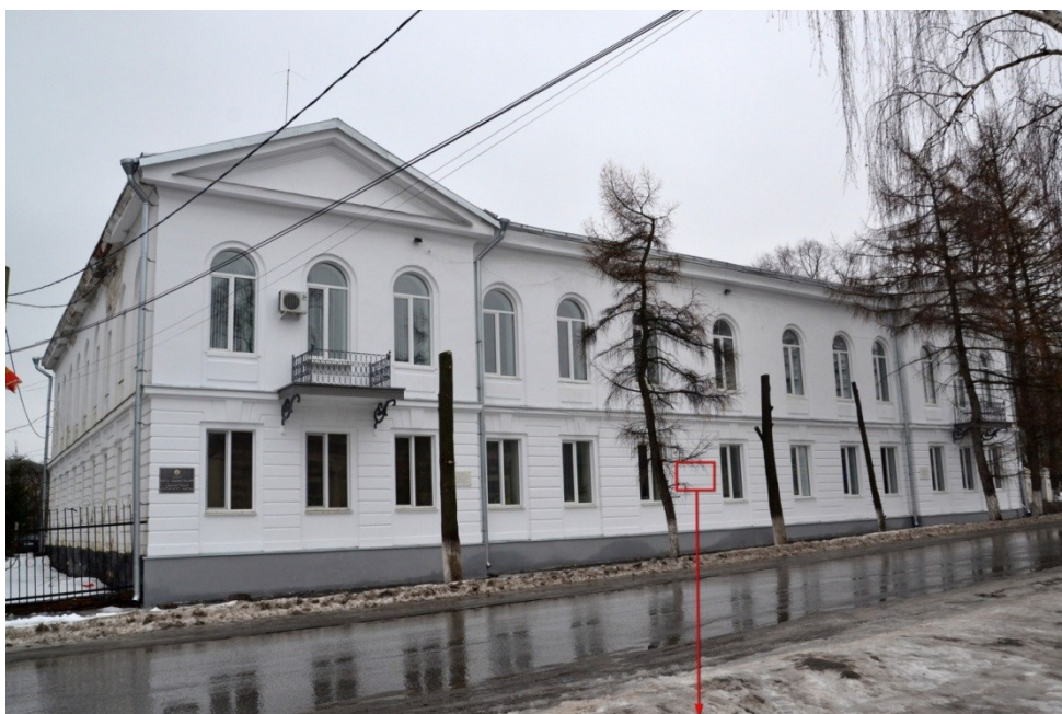
Фото фрагмента фасада с привязкой к месту установки информационной надписи.