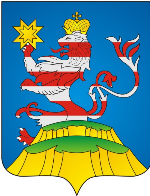
ГЕРБ МАРИИНСКО-ПОСАДСКОГО МУНИЦИПАЛЬНОГО ОКРУГА ЧУВАШСКОЙ РЕСПУБЛИКИ

ПРИЛОЖЕНИЕ 1 к Положению о гербе и флаге Мариинско-Посадского муниципального округа Чувашской Республики