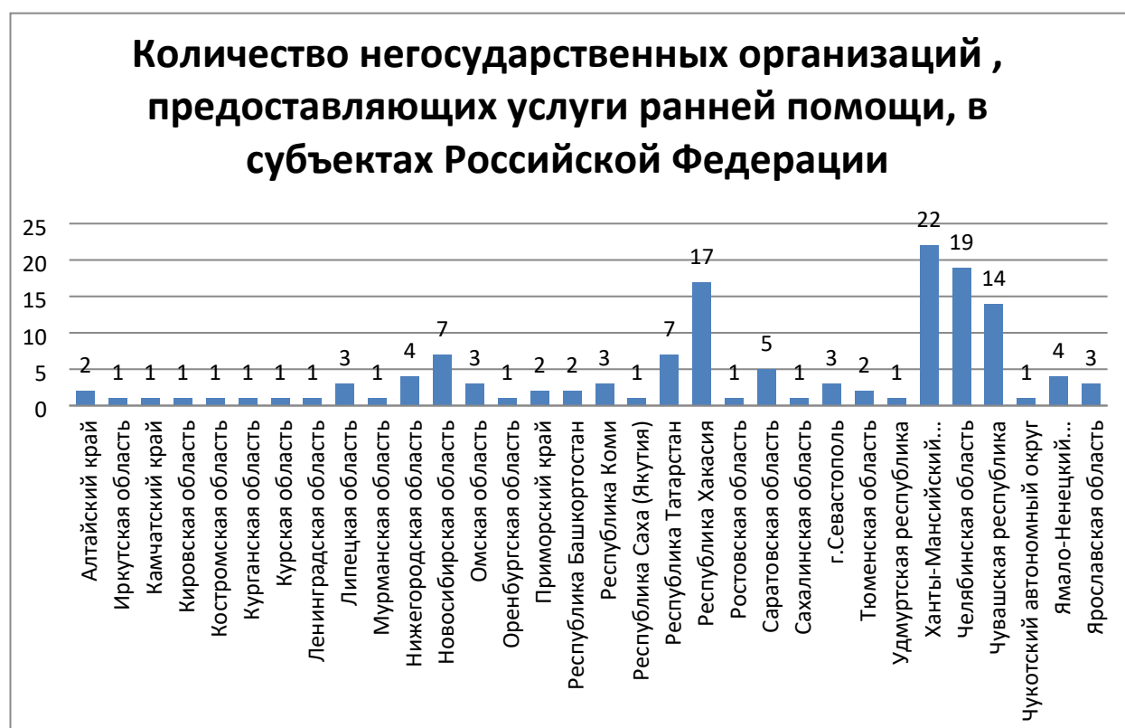
Рисунок 5. Количество негосударственных организаций, предоставляющих услуги ранней помощи, в субъектах Российской Федерации

Распределение субъектов Российской Федерации по количеству негосударственных организаций, предоставляющих услуги ранней помощи, показано на рисунке 5.