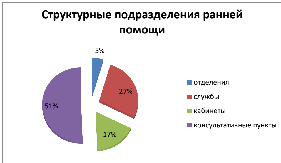
Рисунок 3. Структурные подразделения ранней помощи

Количество государственных (федеральных, региональных, муниципальных) организаций, на базе которых созданы структурные подразделения ранней помощи, распределились следующим образом: