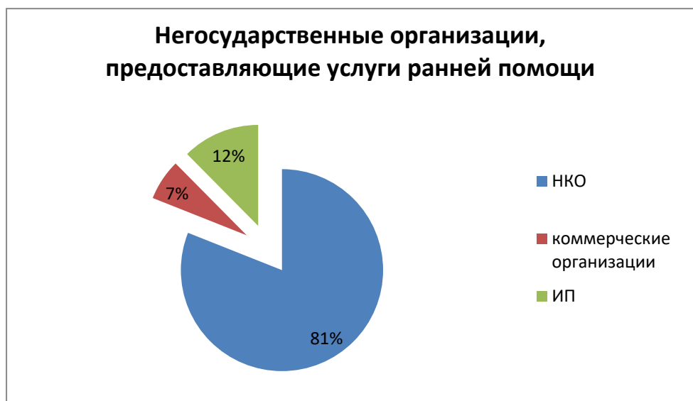
Рисунок 4. Негосударственные организации, предоставляющие услуги ранней помощи

Распределение негосударственных организаций, предоставляющих услуги ранней помощи показано на рисунке 4.