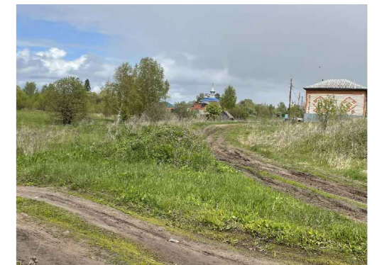
Общий вид ОКН с южного проезда у ул. Тенистой