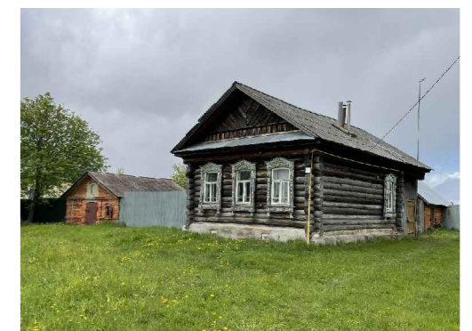
Общий вид традиционного жилого дома