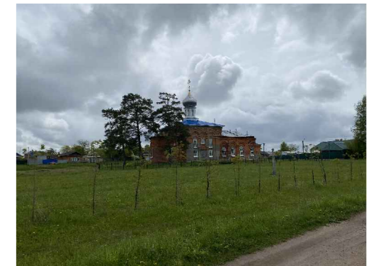
Общий вид ОКН в контексте застройки с северо-запада (ЦНВВ "А")