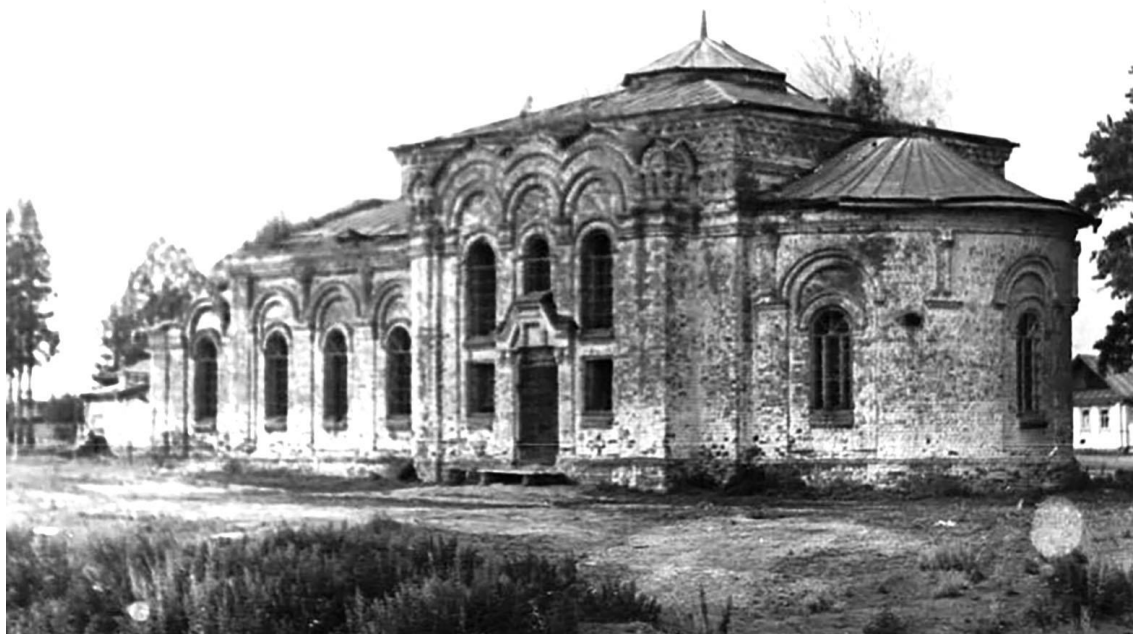
Фото 1970-х годов