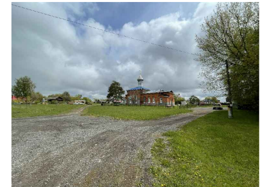
Общий вид ОКН с запада (ЦНВВ "Б")