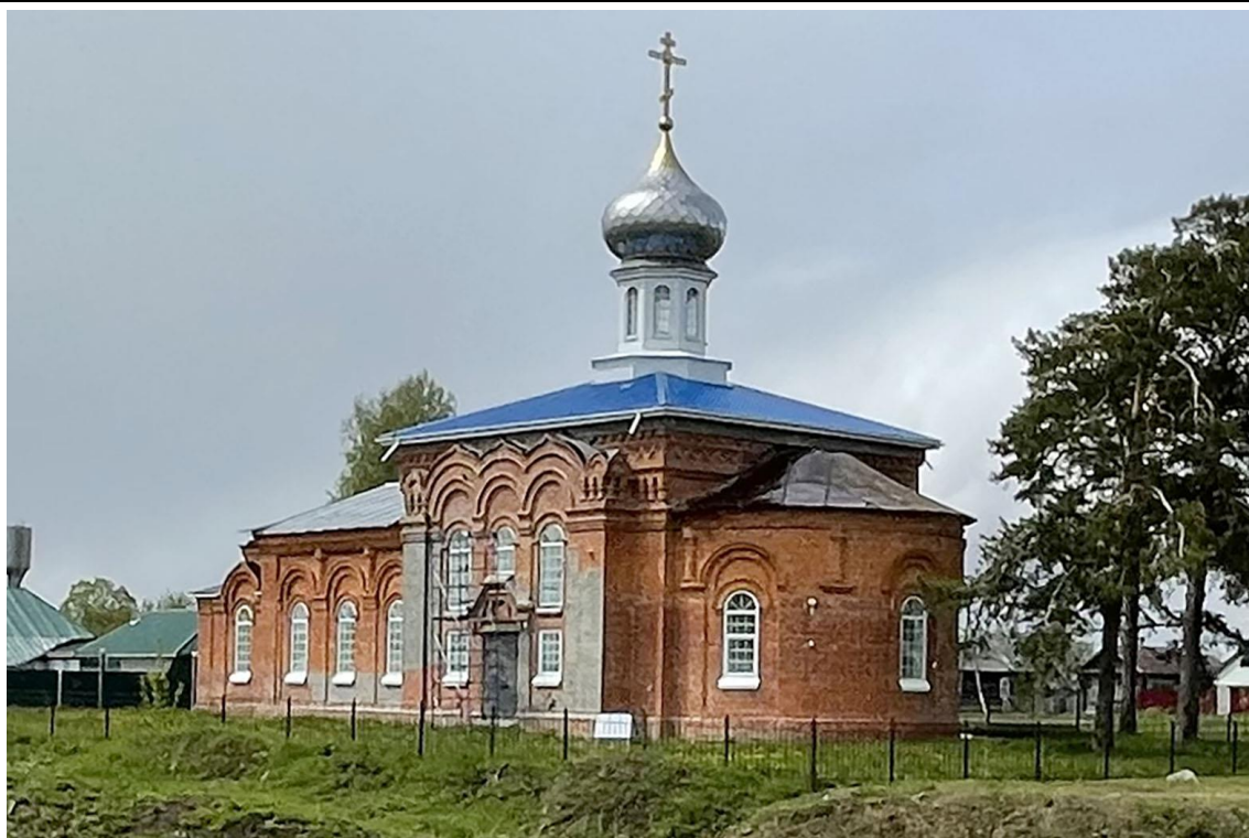
Фото 2022 года