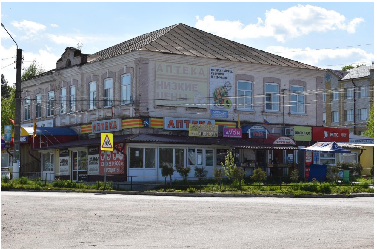
Фото № 4. Объект, обладающий признаками объекта культурного наследия, 2022 г.