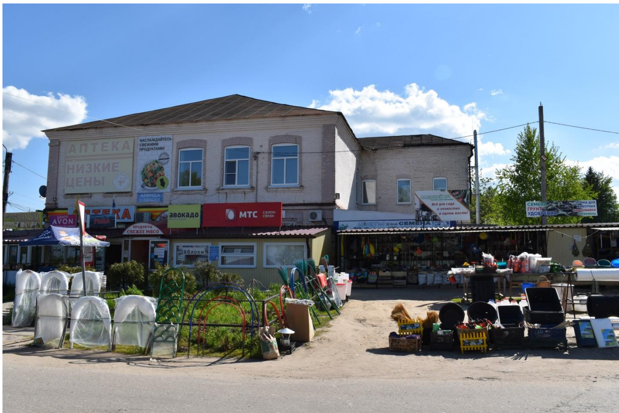
Фото № 5. Объект, обладающий признаками объекта культурного наследия, 2022 г.