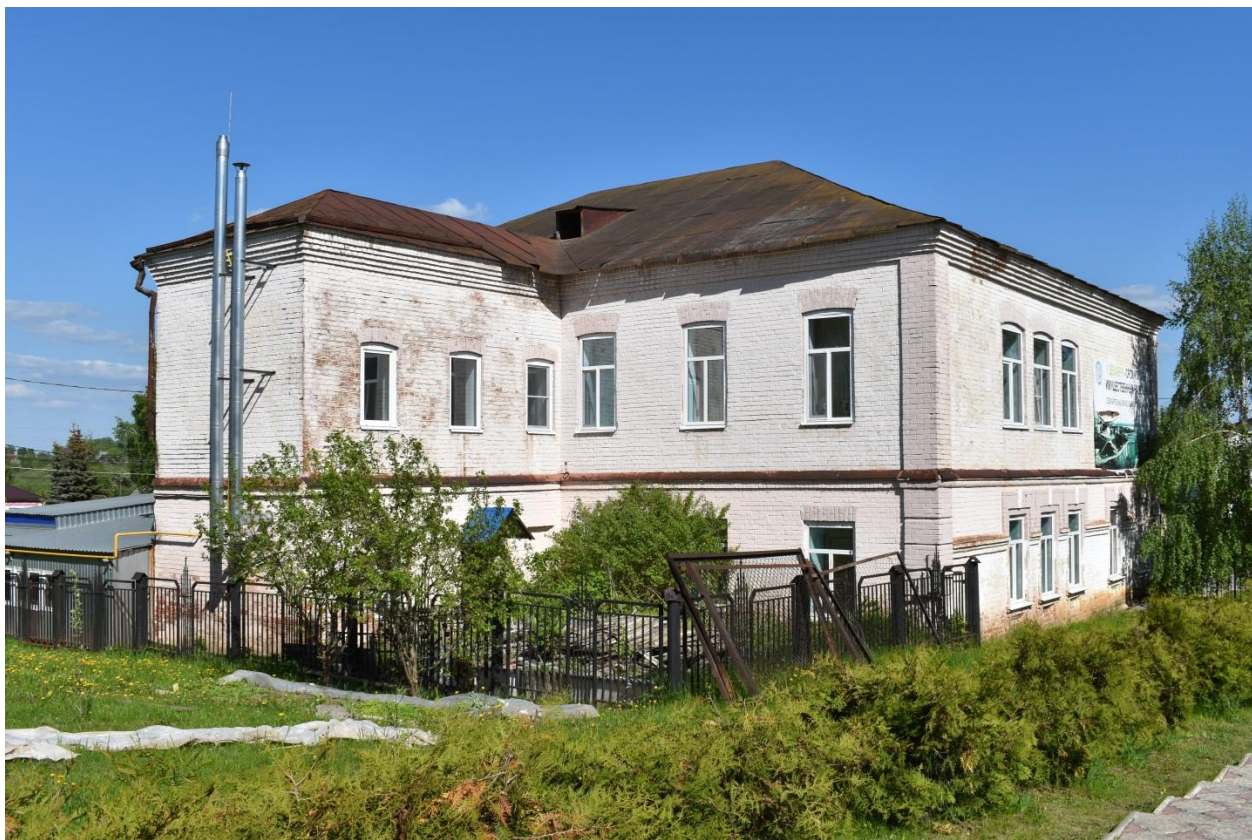
Фото № 6. Объект, обладающий признаками объекта культурного наследия, 2022 г.