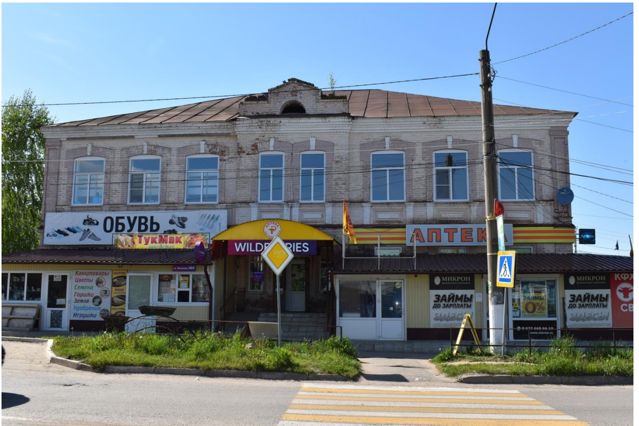
Фото № 3. Объект, обладающий признаками объекта культурного наследия, 2022 г.