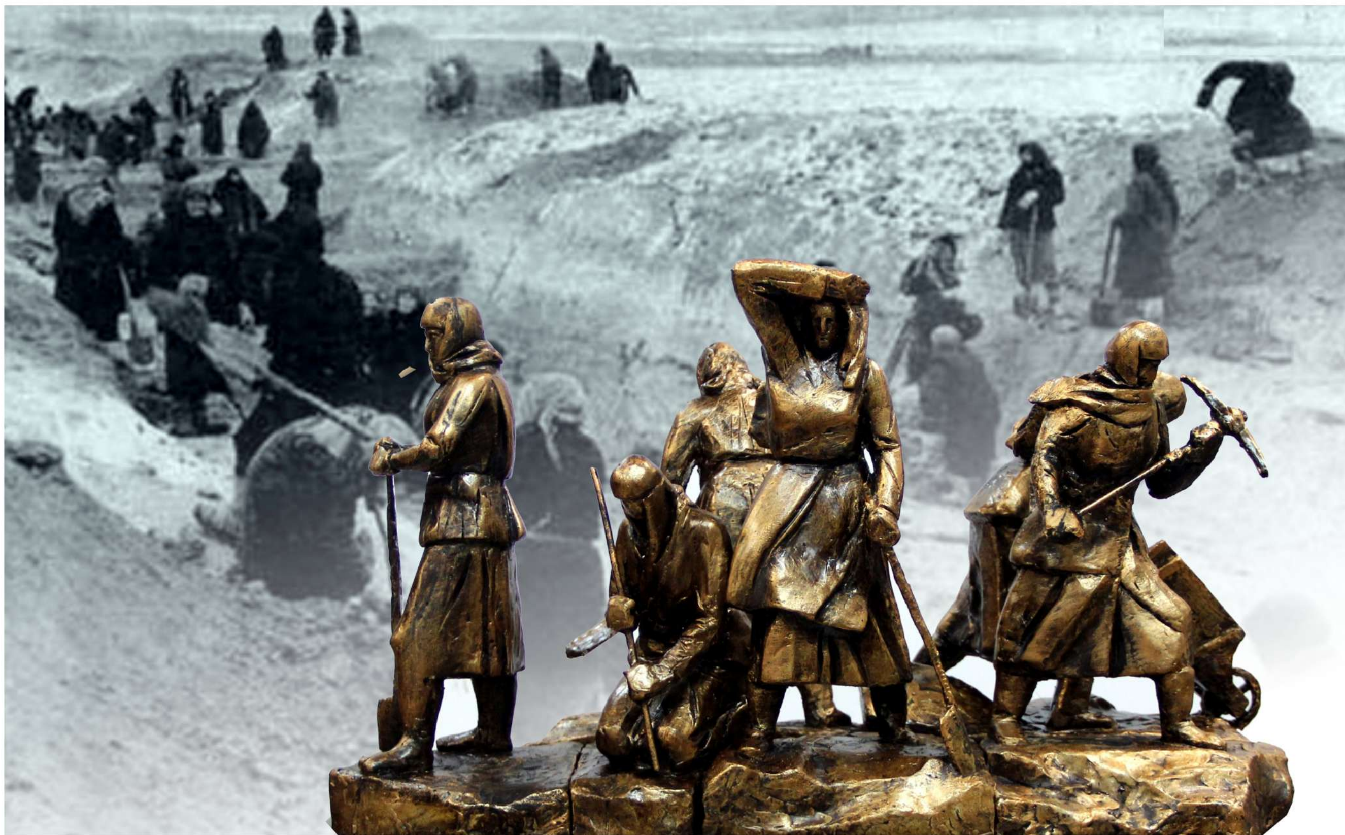
КОНКУРСНЫЙ ПРОЕКТ ПАМЯТНИКА СТРОИТЕЛЯМ БЕЗМОЛВНЫХ БЛИНДАЖЕЙ СУРСКОГО И КАЗАНСКОГО ОБОРОНИТЕЛЬНЫХ РУБЕЖЕЙ В МЕМОРИАЛЬНОМ ПАРКЕ ПОБЕДЫ В Г. ЧЕБОКСАРЫ.