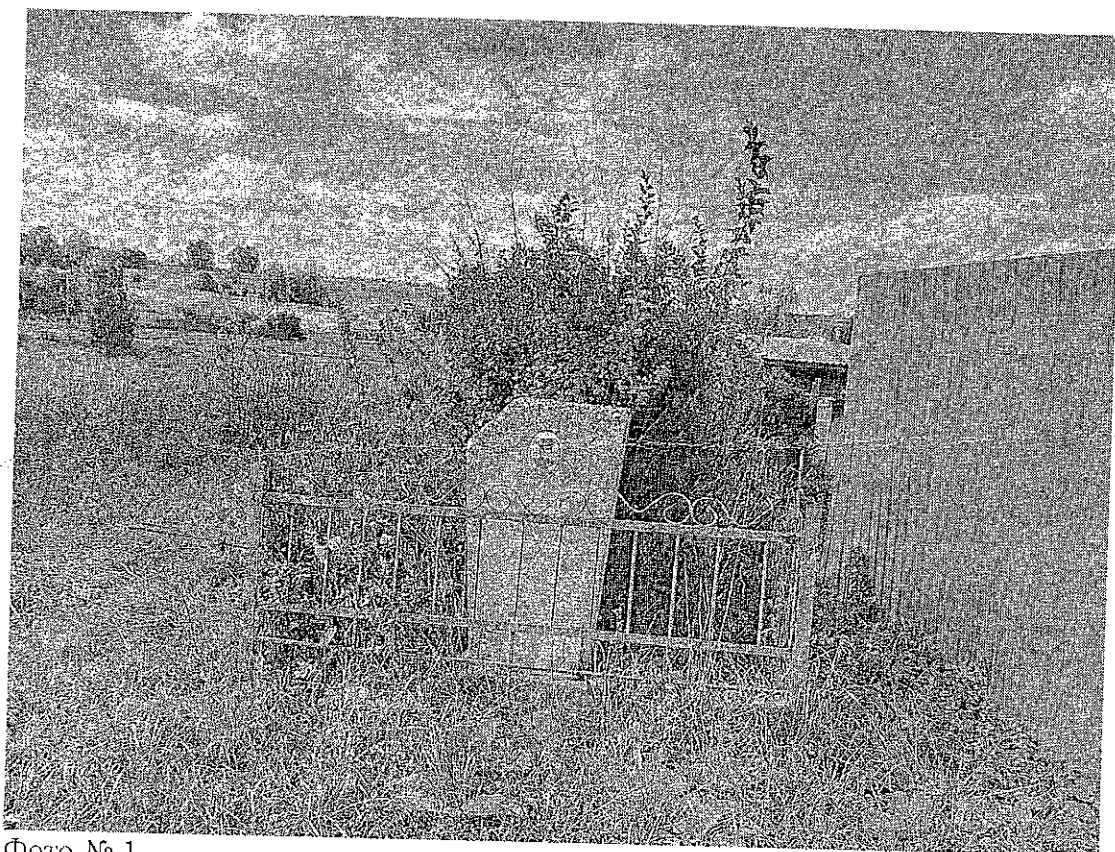
Фото № 1.