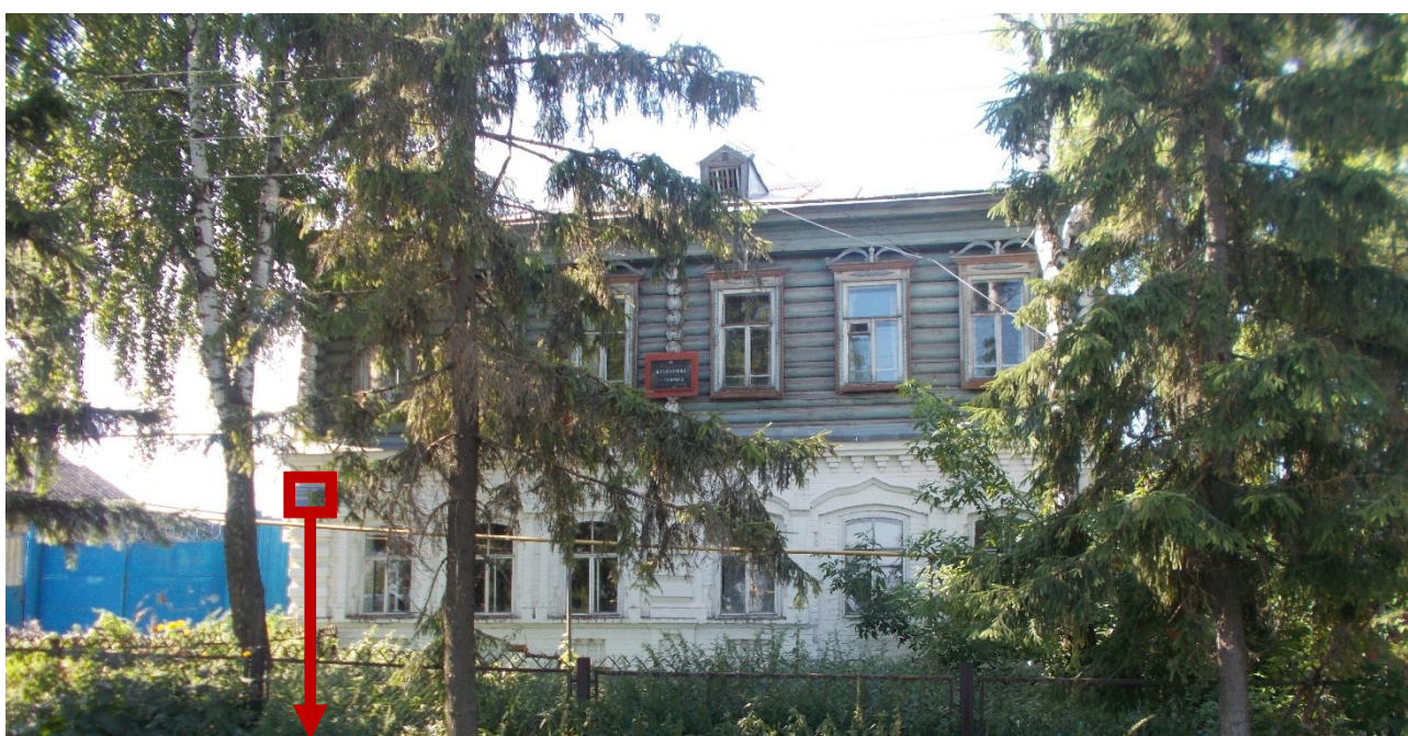
Фото фрагмента фасада с привязкой к месту установки информационной надписи.

5. Схема установки информационной надписи и фотофиксация на месте предполагаемого размещения (фотомонтаж)