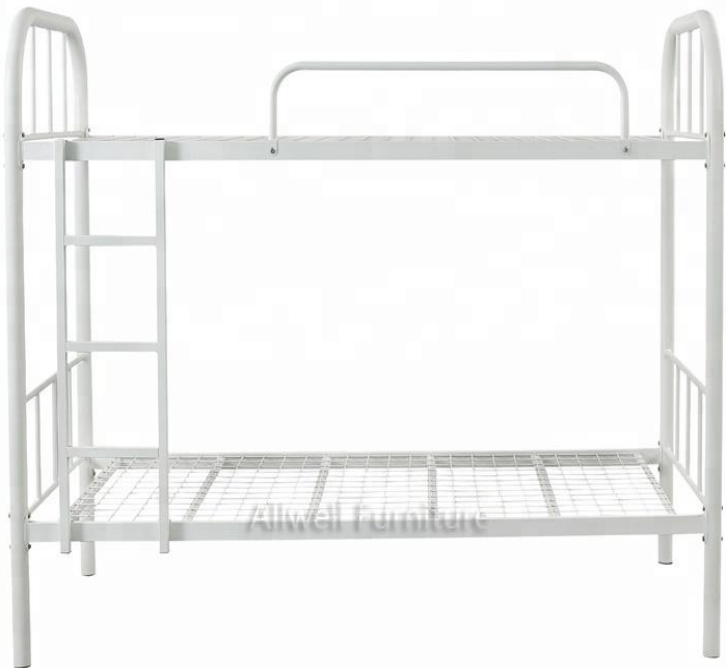
Кровать металлическая 2 ярусная

ФКУ ИК-1 УФСИН России по Чувашской Республики-Чувашии 428000, г. Чебоксары, пос.Новые Лапсары, Лапсарский проезд , 17 Тел:39-01-16 E-mail: gpbakik1@ya.ru