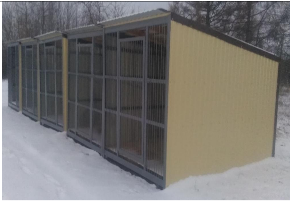
Вольеры для собак

ФКУ ИК-1 УФСИН России по Чувашской Республики-Чувашии 428000, г. Чебоксары, пос.Новые Лапсары, Лапсарский проезд , 17 Тел:39-01-16 E-mail: gpbakik1@ya.ru