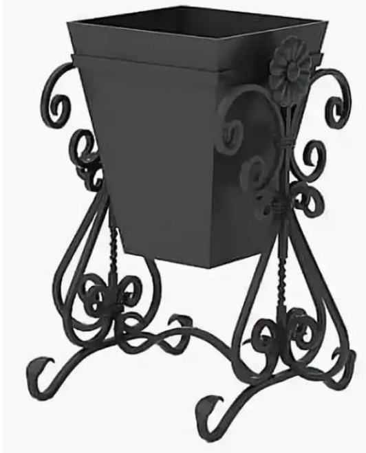
Урна антивандальная (вариант №1)

ФКУ ИК-1 УФСИН России по Чувашской Республики-Чувашии 428000, г. Чебоксары, пос.Новые Лапсары, Лапсарский проезд , 17 Тел:39-01-16 E-mail: gpbakik1@ya.ru