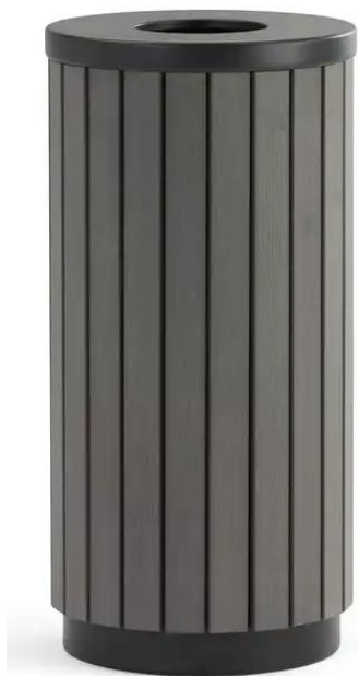
Урна (вариант №3)

ФКУ ИК-1 УФСИН России по Чувашской Республики-Чувашии 428000, г. Чебоксары, пос.Новые Лапсары, Лапсарский проезд , 17 Тел:39-01-16 E-mail: gpbakik1@ya.ru