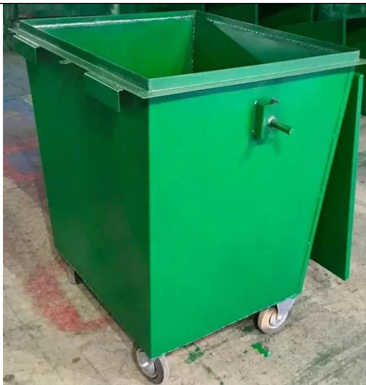
Контейнер для мусора

ФКУ ИК-1 УФСИН России по Чувашской Республики-Чувашии 428000, г. Чебоксары, пос.Новые Лапсары, Лапсарский проезд , 17 Тел:39-01-16 E-mail: gpbakik1@ya.ru