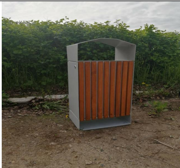
Урна антивандальная (вариант №2)

ФКУ ИК-1 УФСИН России по Чувашской Республики-Чувашии 428000, г. Чебоксары, пос.Новые Лапсары, Лапсарский проезд , 17 Тел:39-01-16 E-mail: gpbakik1@ya.ru