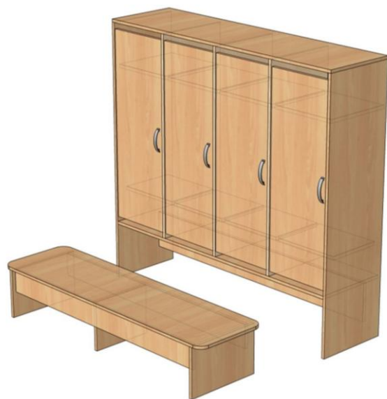
Шкафчик для одежды

ФКУ ИК-6 УФСИН России по Чувашской Республики-Чувашии 429950, Чебоксарский район, д. Толиково, ул. Большая, д. 50 Тел: 8(8352)73-91-89 E-mail: ul346@mail.ru