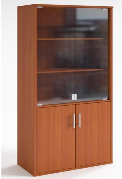
Шкаф для документов со стеклом

ФКУ ИК-4 УФСИН России по Чувашской Республики-Чувашии 428022, г.Чебоксары, ул. Якимовская, 90 Тел: 8 960 309 24 31 E-mail: volga4@rambler.ru