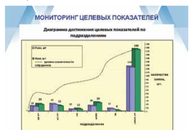
Диаграмма достижения целевых показателей

Для того, чтобы у рабочих появилась возможность самим подавать рационализаторские предложения, в цехах основного производства будут организованы информационные стенды, на которых будут размещены специальные бланки и инструкции по их заполнению. Заполненные рабочими бланки уполномоченный будет вводить в электронную базу, откуда они будут поступать в ООЭУ для дальнейшей обработки.