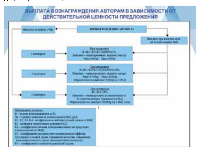
Схема вознаграждения авторам в зависимости от действительной ценности предложения представлена на слайде (см. фото ниже).

— Какие приняты меры для вовлечения персонала в рационализаторскую деятельность?