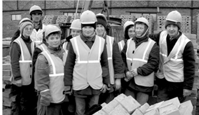
Кирпеч суйласа купалакансен бригади ёсре хастар.

сүретёп. Кирпеч туса каларас ёс маншан сёнёлөх мар. Ку производствана эпё 6 сүл хушши кирпеч заводёнче ёслесе аван пёлесе ситнэ.