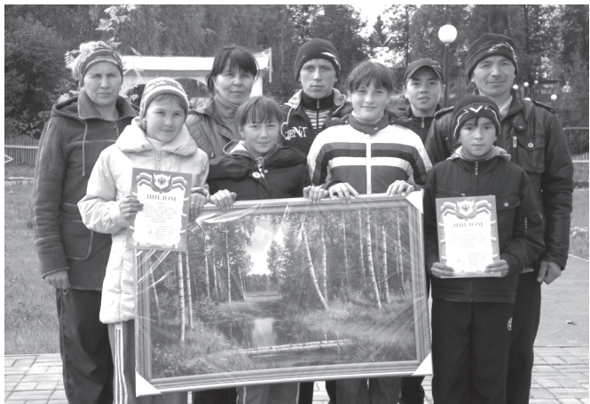
Тойкилтё шулё DVD-плеер та, картина та сёнесе илчэ.