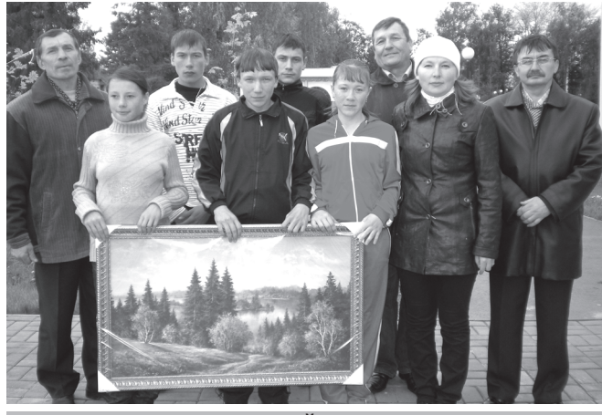
Иккёмеш вырана тухна Иуҫкасси шулён команди ситес сұл сэнтёрёҫё пуласса шантарчэ.

раҫ спортсменёсене аһаҫла стартпа финиша хаварт ситме суннипе пёрлех учительёсене вёсен профессие уявё ячёпе те саламларёс. Каҫалхи амартура учительёсем те вай виҫме пулчёс-ске.