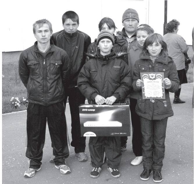
Ҫатракасси шулё ҫамал атлетика сезонне сэнтёрёҫё вёслерё.

Вёсен пашарханавёсем хыҫа юлчёс, старта вара ватам шулсенче вёренекен ҫак усёмри хёр ачасемпе арсын ачасем тухрёс. Вёсем те ҫав дистанциех чупса хайсен