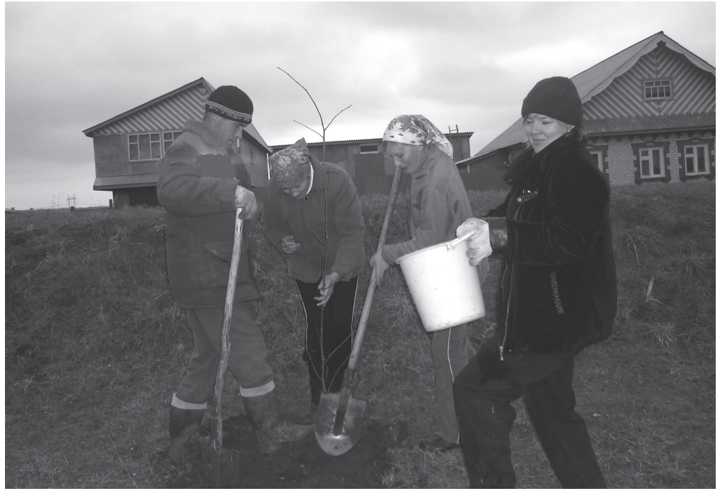
Ләхөнчөх «кирлө мар» хә-масем тупәннә иккен.

Кашни хунава шәварнипә сөс сьрламарөс сәмрәксем, йывәссем тавра кәртә тьтма та үркөнмерөс. Хәмисене астан тупнә тетөр-и? Кашнийөн ху-