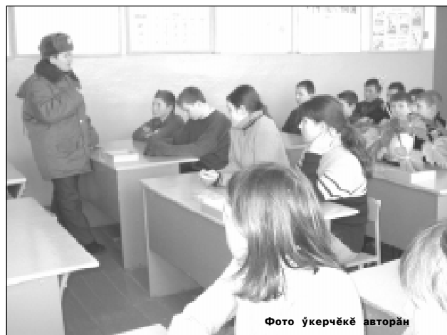
Фото укөрчөкё авторан

Вараланчак пэру пётём кётёве варалать тесчө те ваттисем. Паллах, шулта та йёркене пасаканни пёрех тупанат. Кунта халё 3 ача учётра тарать. Красноармейс-