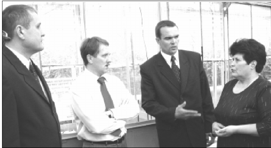
«Ольдеевская» агрофирма тёрлё сёртен ханасем час-часах пуласчё. Кунта республикăри, Раçсей шайенчи меропрятисем те йёркелесчё.