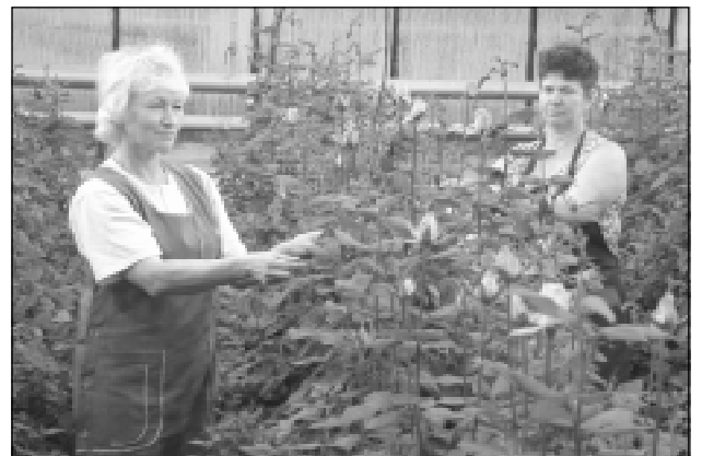
Роза чечекё ситёнтермелли сёнё теплицара мён тёрлё чечек үсмест пулё. Ахальтен мар агрофирма ирттерекен куравсене сынсем сахал мар сўресчё. Сутусасемпе туянакансем те хамар тăрăхра үстернё чечексене кăмалласчё.