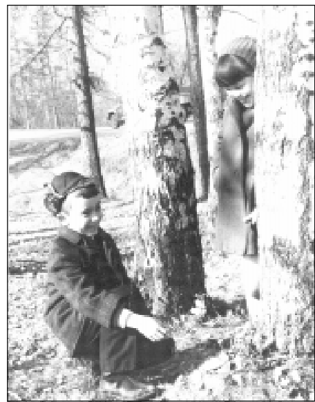
Печек качапа хер сурхи перремеш чечекпе киленеҗсе.

Папка саралма пулсан вахатра улма-сырла йываҗсисене бордос шевекпе тепер хут, 10 литр шывек сине 15-20 грамм деҗисе е цитор хушса сапсан аван.