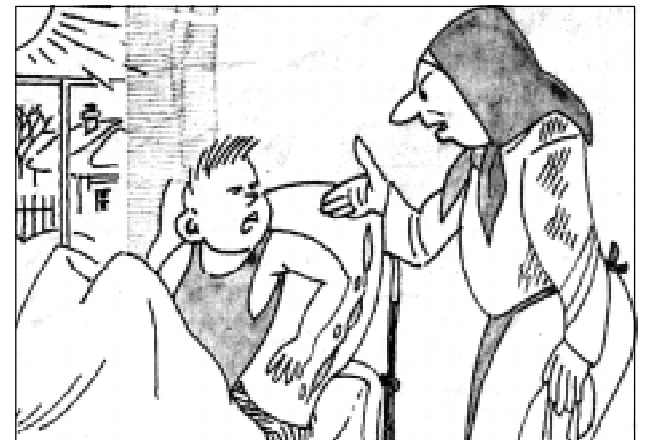
- Мӑнукӑм, шука кайма вӑхӑт. - Кайматӑп, ӑнерхи «иккӑе» пӑллӑшӑн забастовка пуҫлатӑп...

Икӑ мучи тӑл пуллӑ. - Саламлатӑп, Кӑркури,- тенӑ Иван ала панӑ май.- Эсӑе пирус туртма пӑрахӑн теҫӑҫ. - Тӑрӑсах. Пирус туртма пӑрахӑн. Халӑе туранӑ табака чӑлеме тултарса туртатӑп,- хуравланӑ Кӑркури.