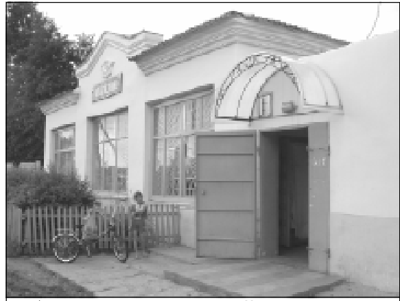
* Апах магазинё сакан пек илемлё.

- Сагла, эфир хамар производствана самана ылмашавне кура та йёркелеме тарашатпэр. Сакёр пекарни, пылак шыв тултаракан, пула таварлакан цехсемпе пёрлех пластмасса кёленче - пёчёк формаран сават - таватпэр. Ку кёленчене хамар производствара уса курнипе пёрлех сутатпэр та. Сёвё цехё хамар суту-илу точисене вырэн таврашё, халат-кёпе т.ыт.те сёнет. (Вёсё 7-мёш страницэра.)