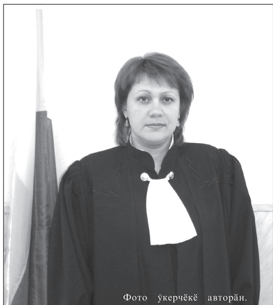
Фото укерчәккә авторән.