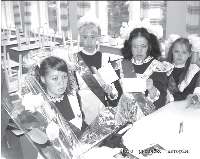
Темисө минутран – юлашки шанкәрав.