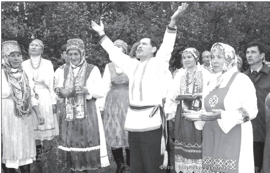
Фото үкерүҗкө авторән.