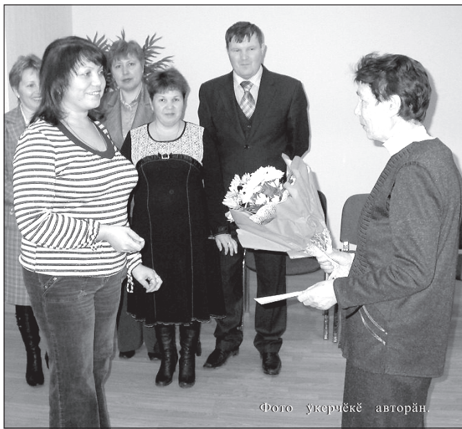
Банк ёҗченёсем Е.И.Андреевана (сылтамри) саламланя самант.