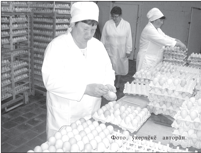
«Чаваш бройлерө» АУО – аңаслә ёслекен ял хушалах предпритийёсенчен пөри. 2007 сулхи фото үкерчөк.

Выльах-чёрлэх отраслө пирки каласнә май, кайах-көшөкө патне таврәнса вөсен ёне кәтартса паракан телөр цифра илсе парар. Шел те, анча