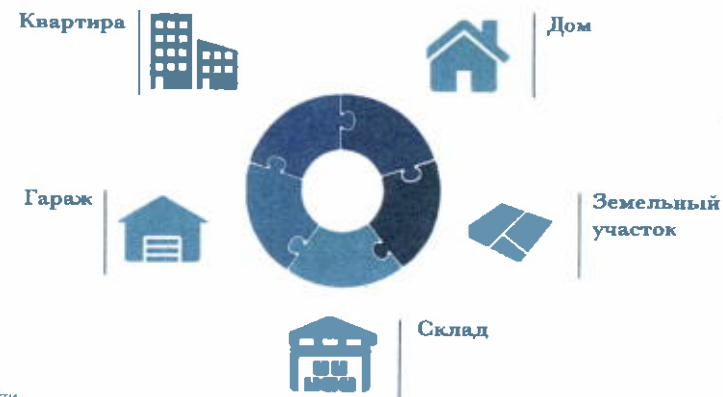
Схема 2. Основные объекты недвижимости

61. Указанию также подлежит недвижимое имущество, полученное в порядке наследования (выдано свидетельство о праве на наследство) или по решению суда (вступило в законную силу), право собственности на которое не зарегистрировано в установленном порядке (не осуществлена регистрация в Росреестре).