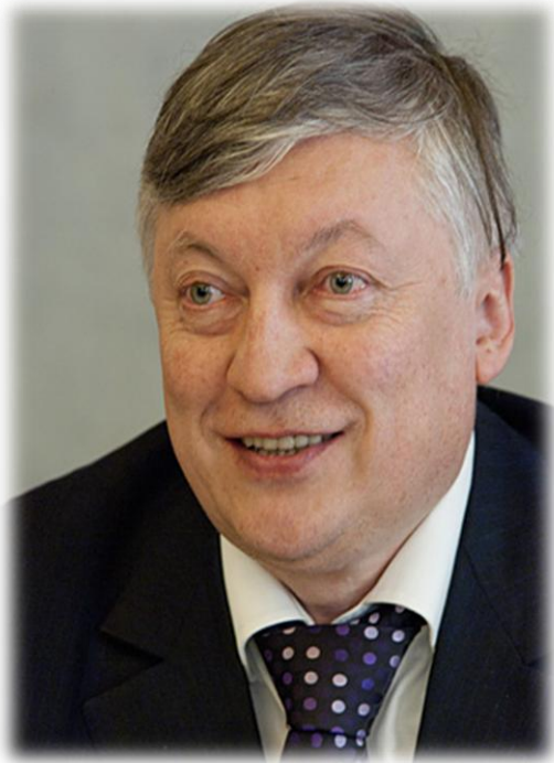
Карпов А.Е. Депутат Государственной Думы РФ, Чемпион Мира по шахматам

«Я очень надеюсь, что в Год охраны окружающей среды эта акция поможет не только собрать мусор, но и преподаст отличный урок бережного отношения к природе школьникам накануне Дня знаний, а взрослым - поможет конкретными делами продемонстрировать свое право жить на чистой земле и дышать чистым воздухом».