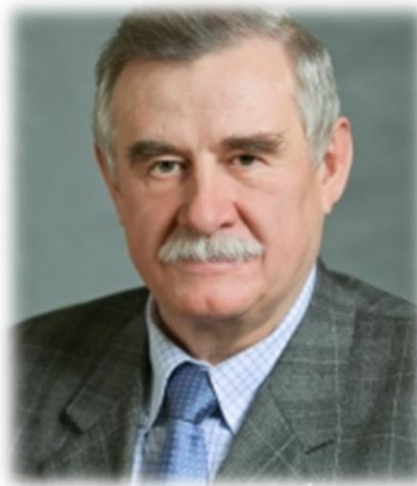
Чуркин Н.П. Член Совета при Председателе Совета Федерации РФ по агропромышленной политике и природопользованию