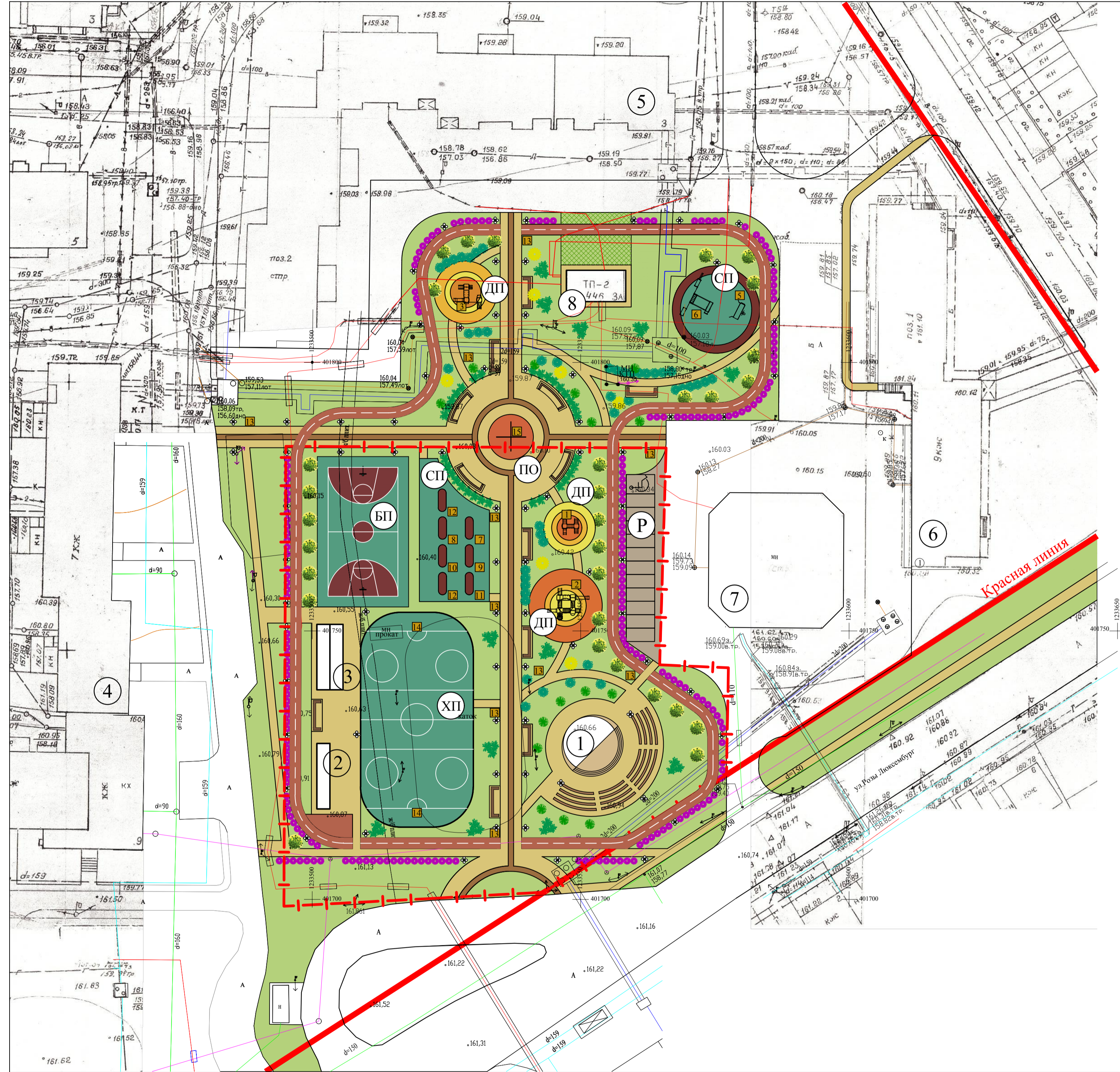
ВЕДОМОСТЬ ПРОЕЗДОВ, ТРОТУАРОВ, ПЛОЩАДОК