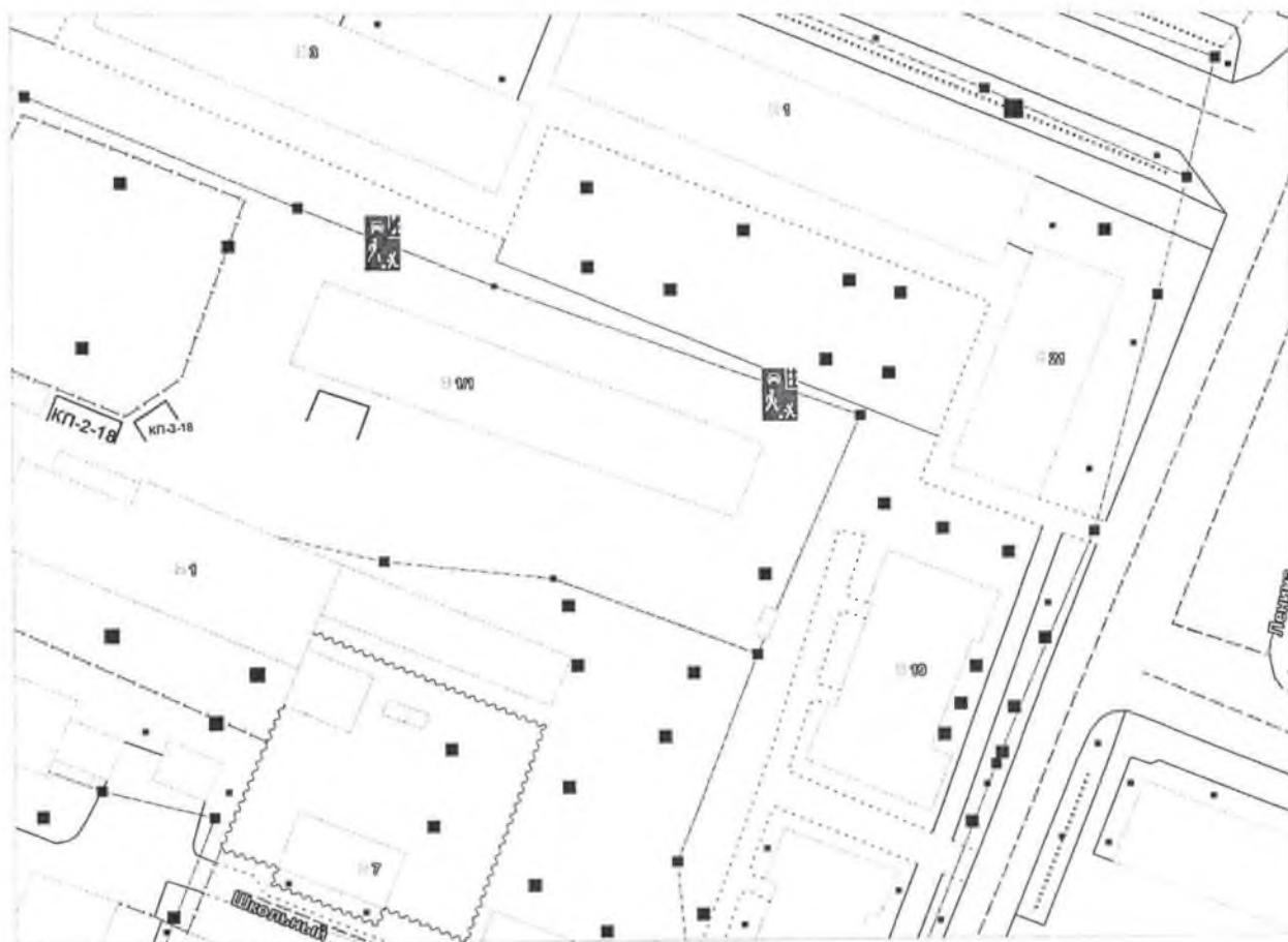
Схема установки дорожных знаков во дворе дома 1 корпус 1 по улице Ленина

Приложение к распоряжению администра- ции города Шумерля № 278-н от 29.11 2019 г.