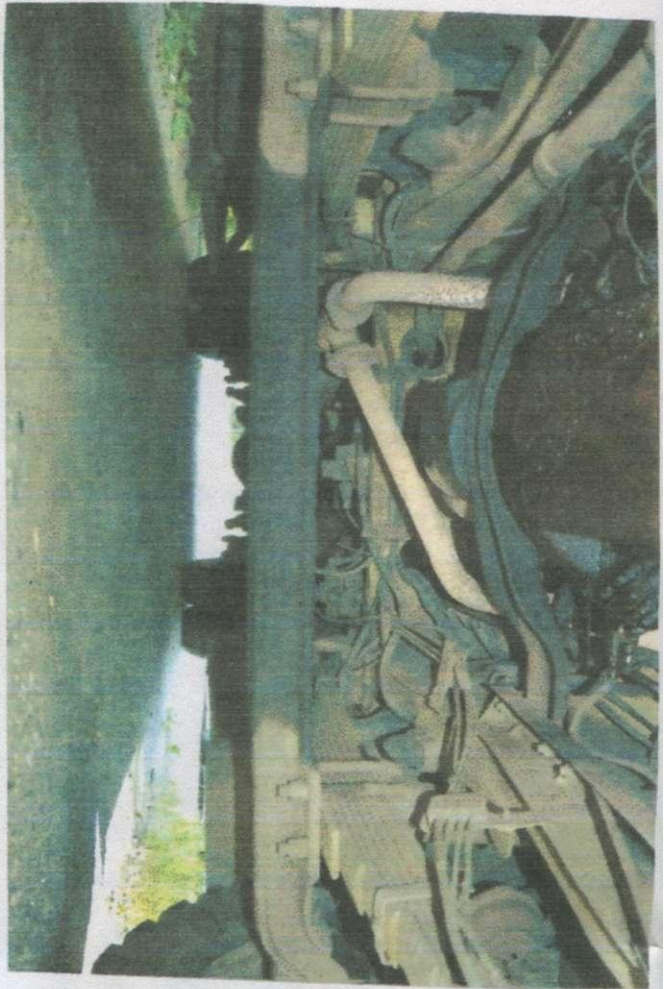
ООО "ЛНО "Меридиан"