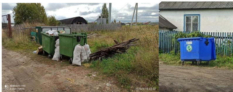
Поселения Вурнарского района

площадок ТКО. Указанные факты установлены в поселениях Моргаушского, Вурнарского районах. Кроме того, в отдельных случаях не соблюдается расстояние от контейнеров до жилых зданий, детских игровых площадок, мест отдыха и занятий спортом, которое должно быть не менее 20 м, но не более 100 м.