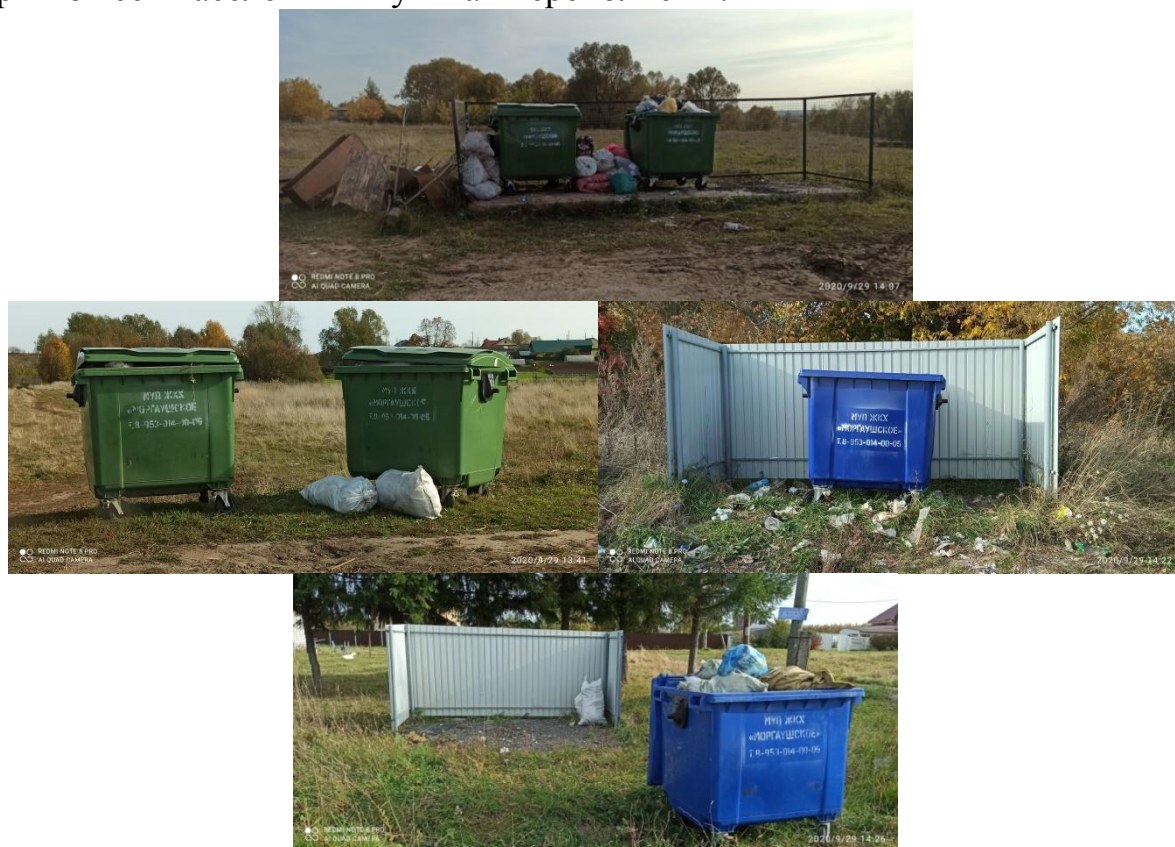
Поселения Моргаушского района

Муниципальными районами при обустройстве площадок для накопления ТКО не соблюдаются нормы Санитарных правил (СанПиН 2.1.2.2645-10), которыми установлена ежедневная периодичность вывоза или опорожнения контейнеров и других емкостей, предназначенных для сбора бытовых отходов и мусора (пункт 8.2.4). Фактически средняя периодичность вывоза ТКО в проверенных муниципальных районах определена 2-3 в раза в неделю. В то же время в Моргаушском районе периодичность вывоза ТКО установлена 2-3 раза в месяц . В результате при визуальном осмотре мест накопления ТКО установлено, что контейнеры во всех населенных пунктах переполнены.