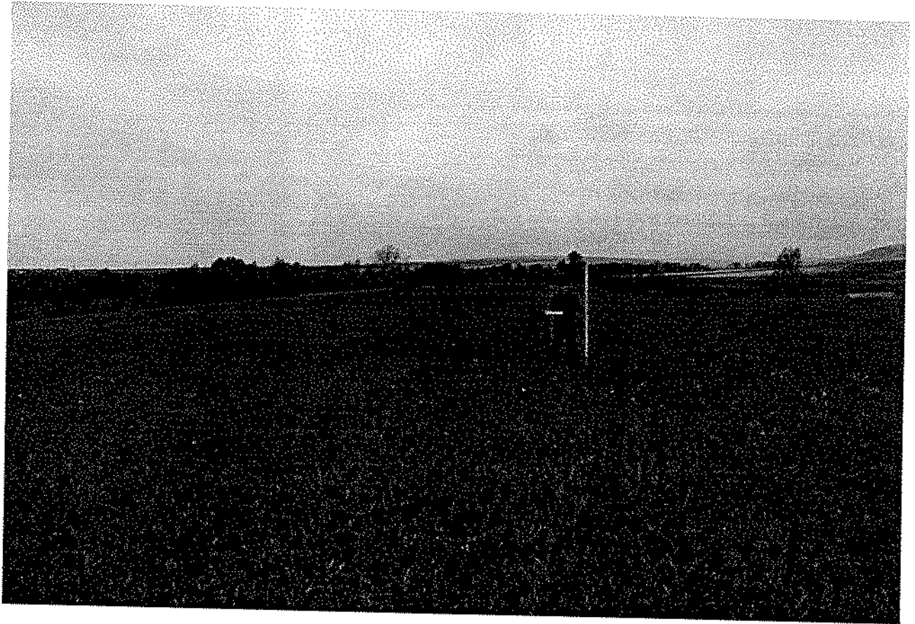
Фото 1. Вид на «Старое кладбище, средние века».