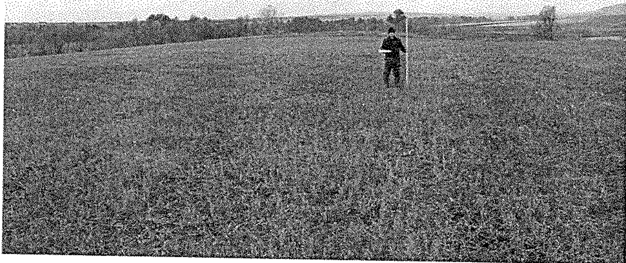
Фото 1. Вид на площадку могильника