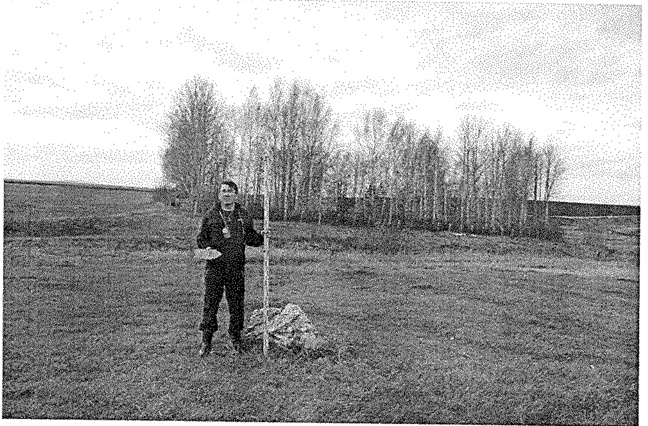
Фото 1. Вид на площадку могильника