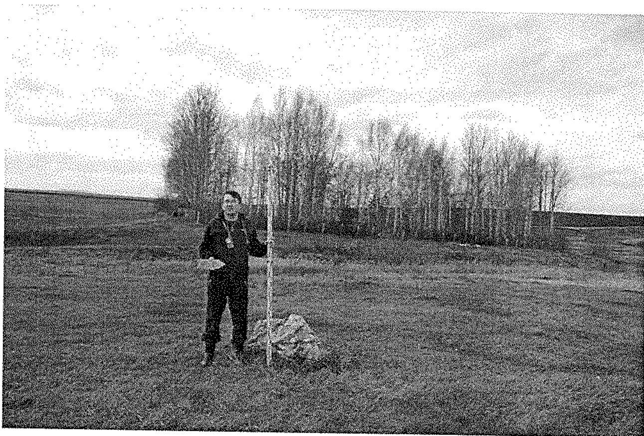
Фото 1. Вид на «Старое кладбище «Кив масар», средние века».