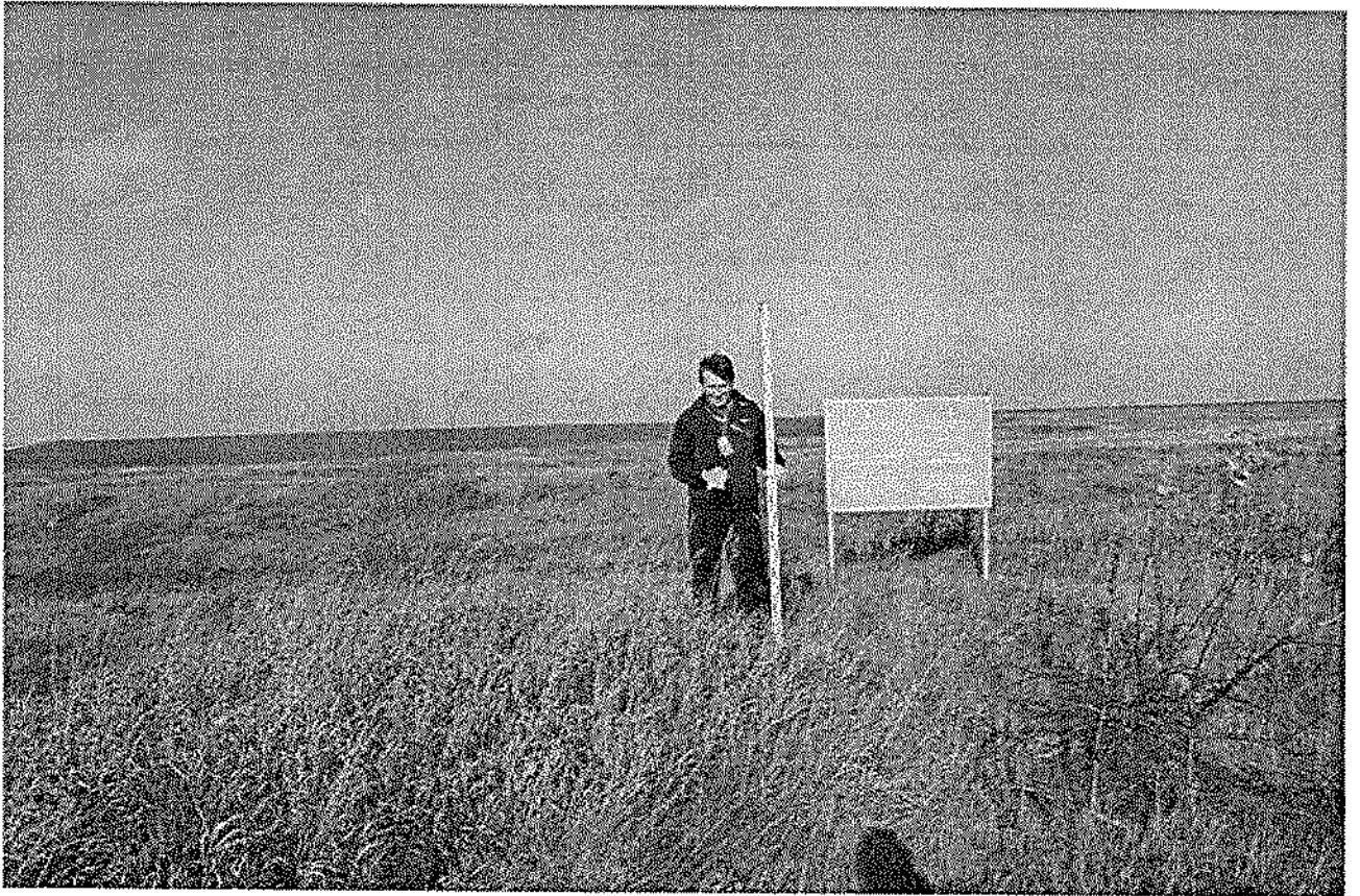
Фото 1. Вид на указатель городища.