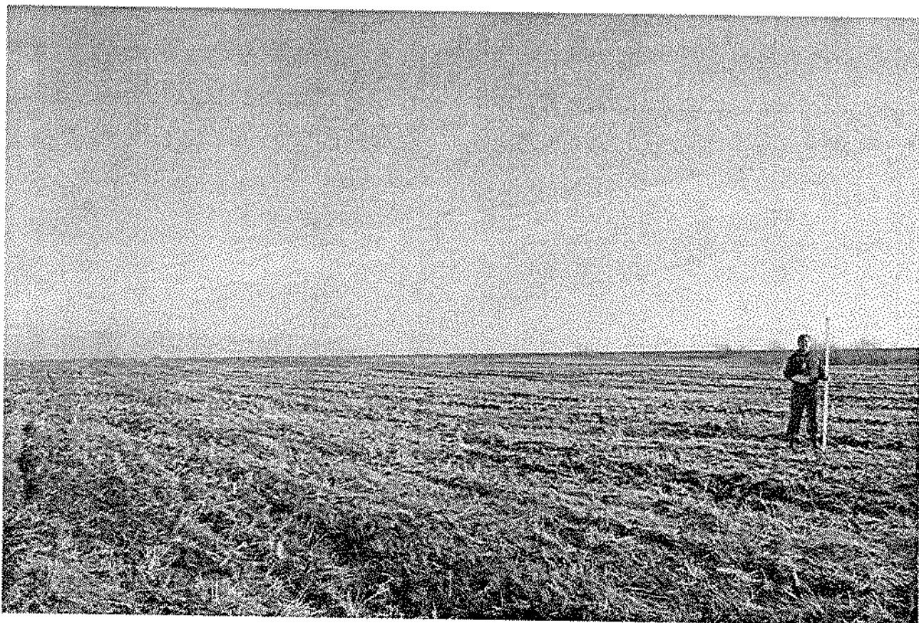
Фото 3. Вид на площадку городища.