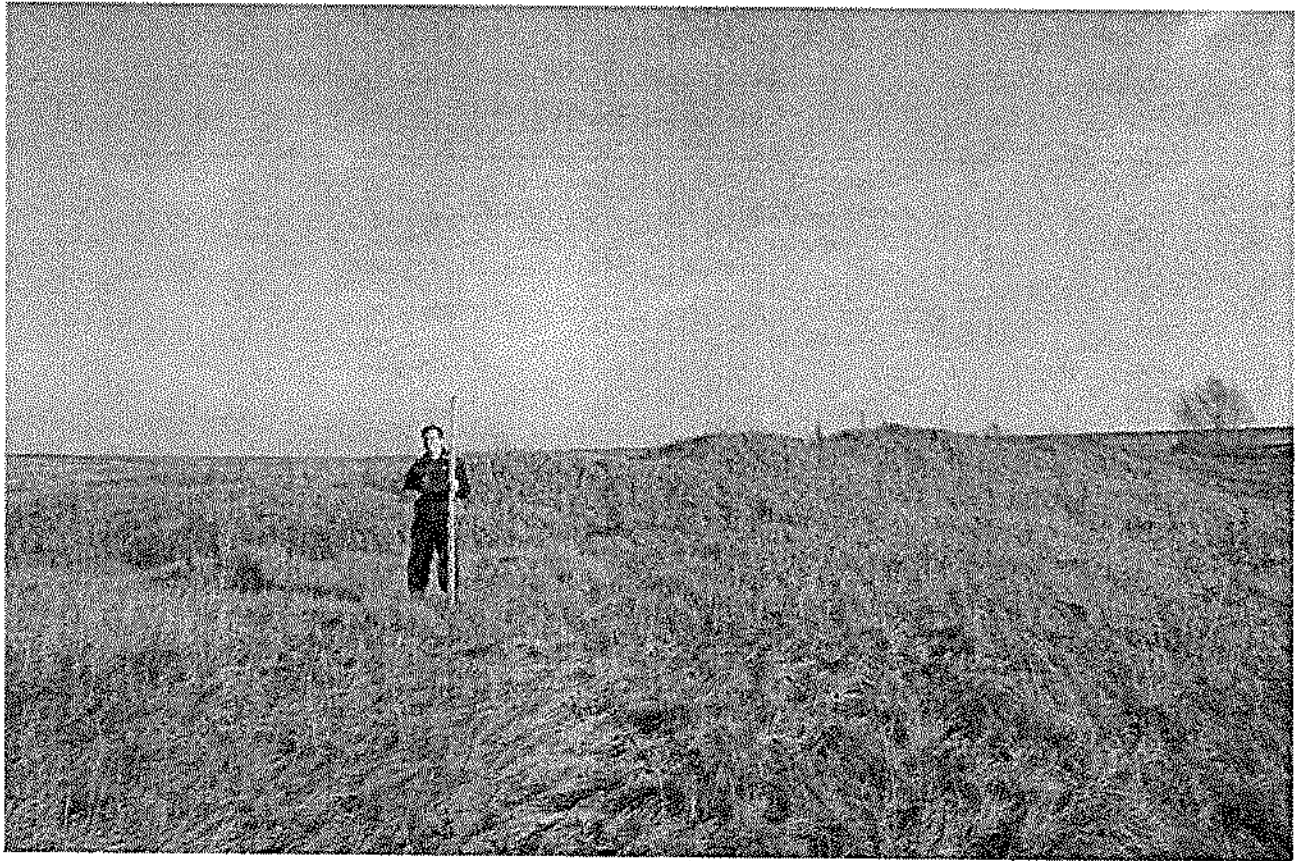
Фото 2. Вид на валы «Городище «Хула выране», средние века».