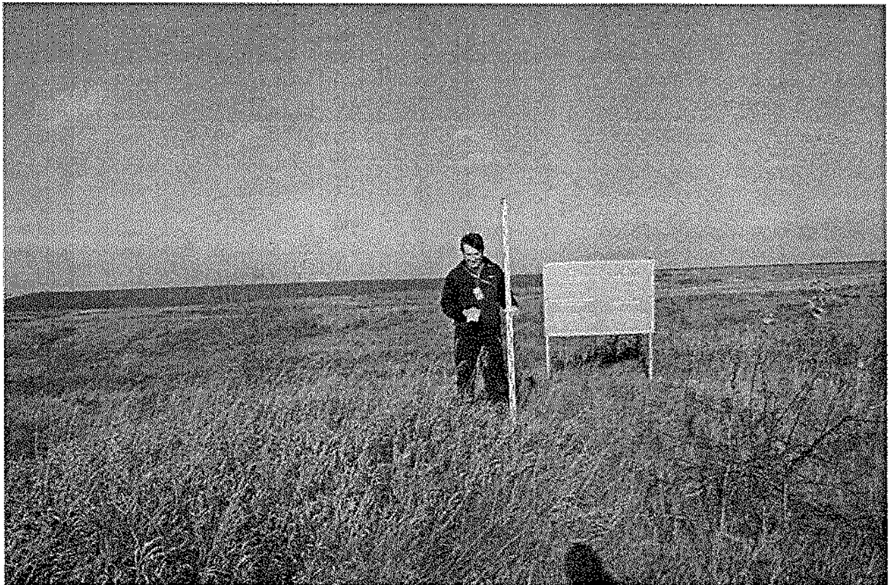
Фото 1. Вид на указатель «Городище «Хула выране», средние века».