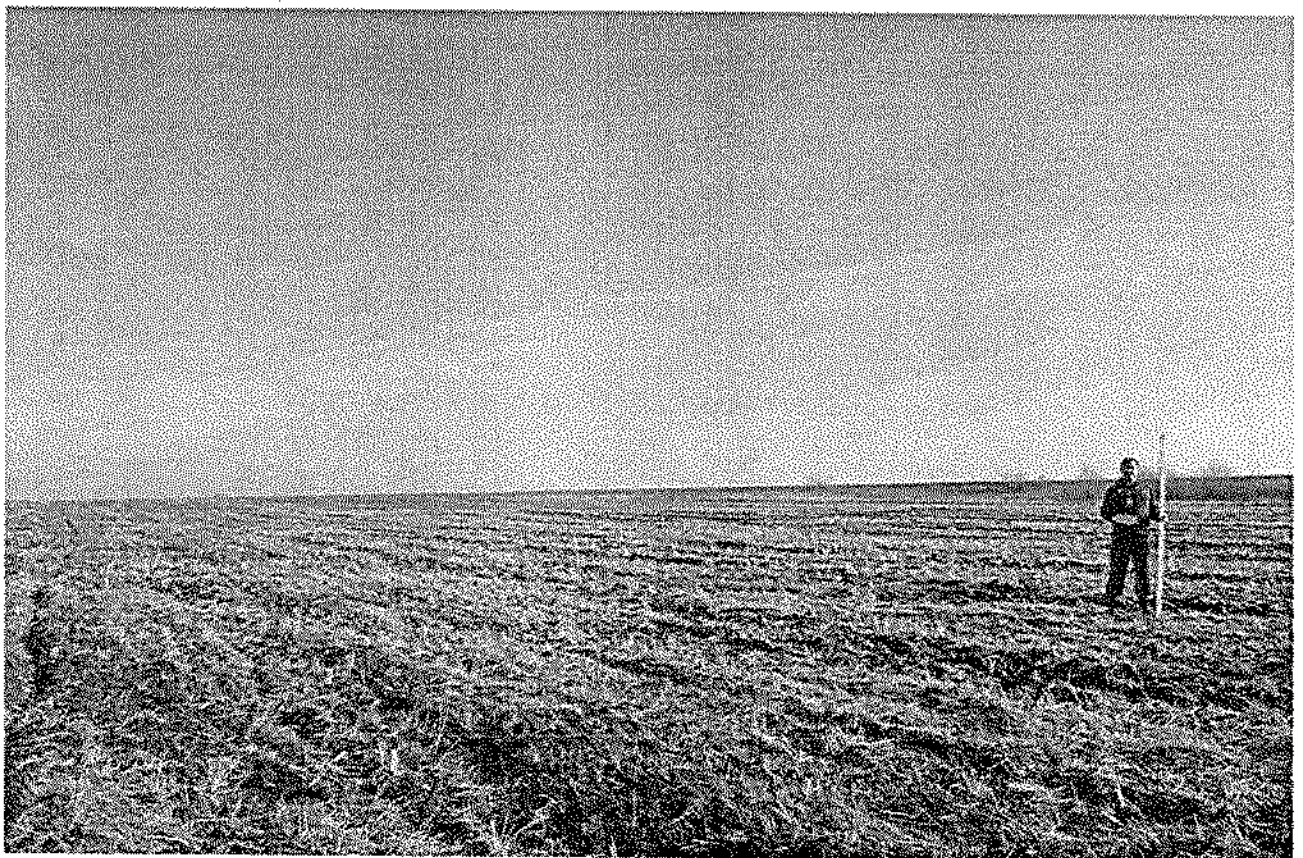
Фото 3. Вид на площадку «Городище «Хула выране», средние века».