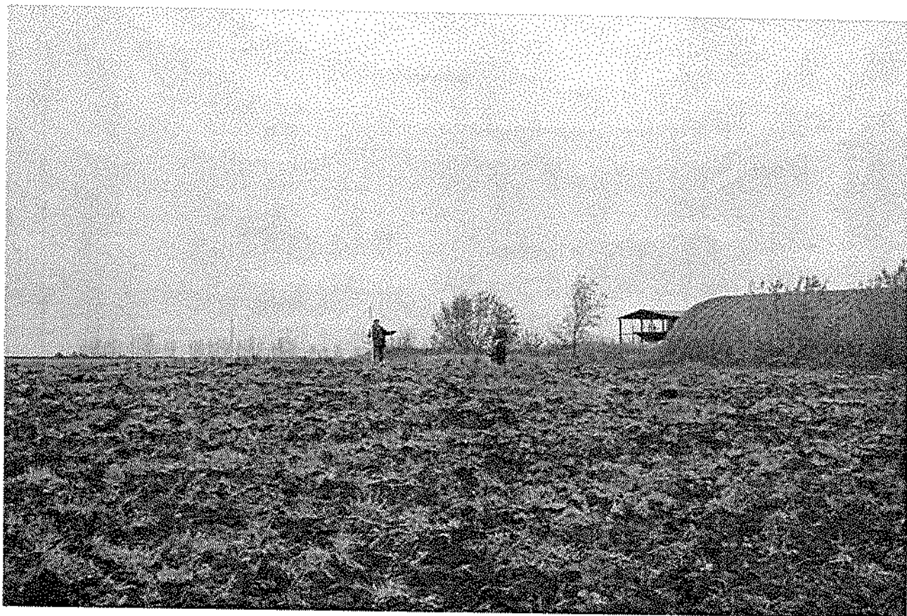
Фото 1. Вид на курган