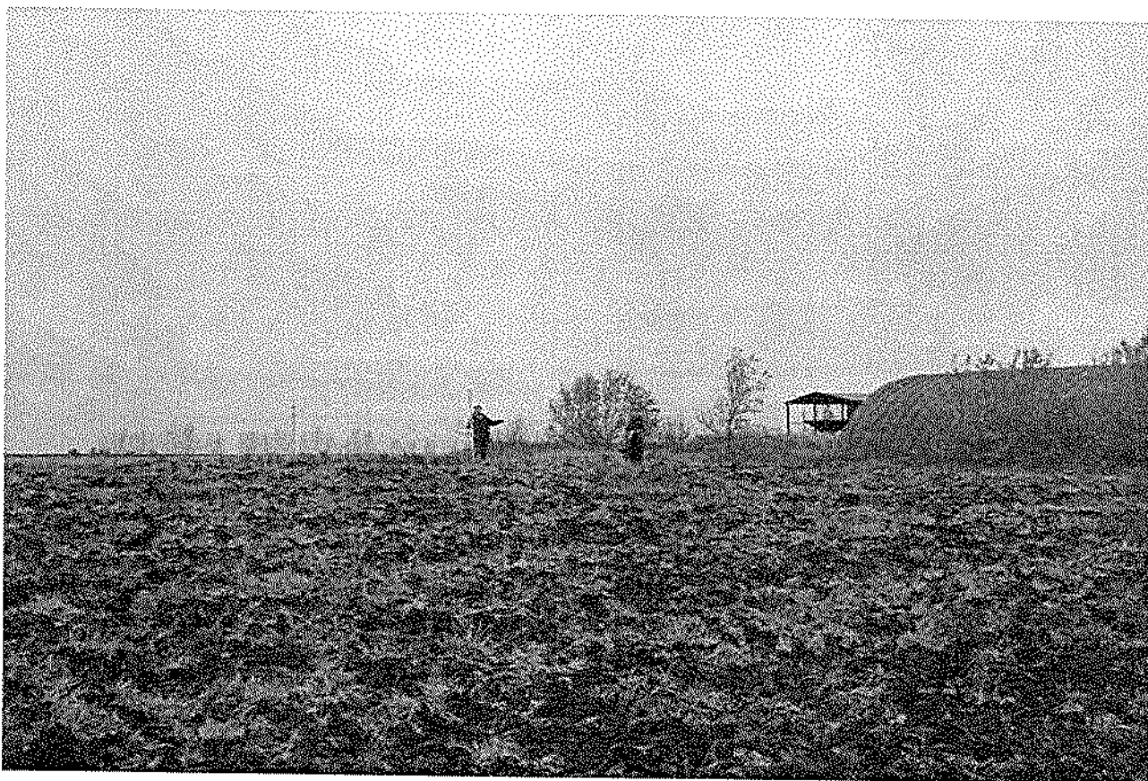
Фото 1. Вид на «Курган «Шеме темески», бронзовый век».