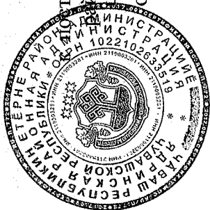
Схема размещения нестационарных торговых объектов на территории Ядринского района Чувашской Республики